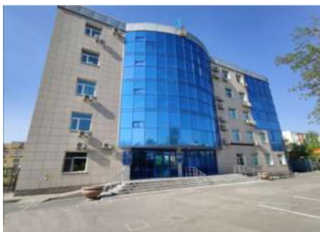
УГД по району Алматы

Департамент государственных доходов по г.Нур-Султан охватывает все 4 района столицы – Алматы, Сарыарка, Есиль, Байконур. В каждом – образованы районные Управления государственных доходов. При управлениях функционируют Центры приема налогоплательщиков, где оказываются государственные услуги. Центры оснащены и оформлены в едином корпоративном стиле. В каждом Центре «Зоны самообслуживания», терминал для налогоплательщиков и аппарат для бронирования электронной очереди.